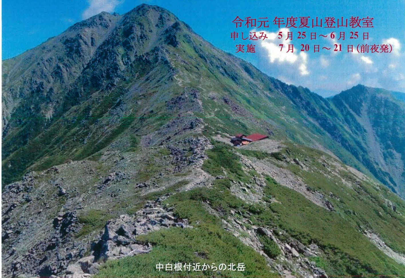
中白根付近からの北岳

令和元年度夏山登山教室 申し込み 5月25日～6月25日 実施 7月20日～21日(前夜登)