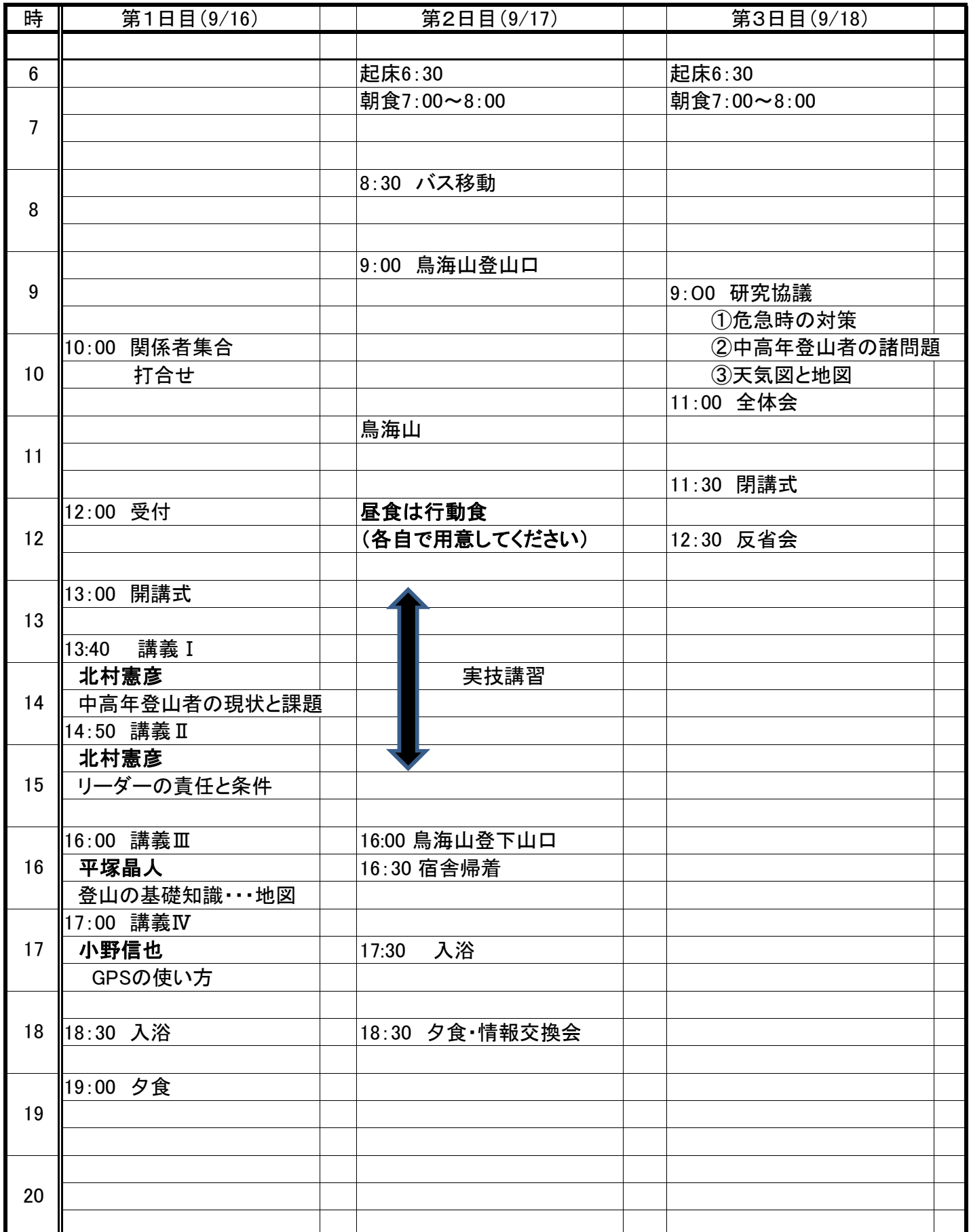
平成23年度中高年安全登山指導者講習会(東部地区)日程表