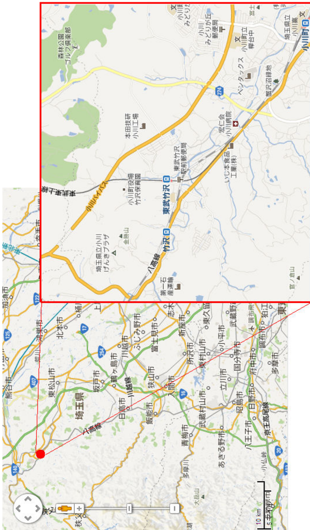
タイムスケジュールと施設見取り図