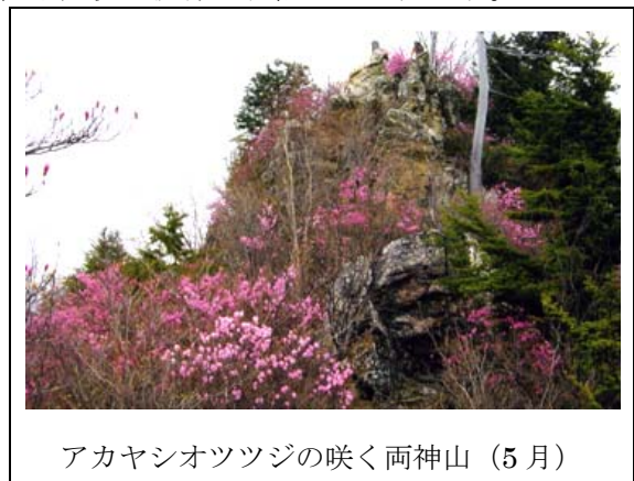
アカヤシオツツジの咲く両神山(5月)