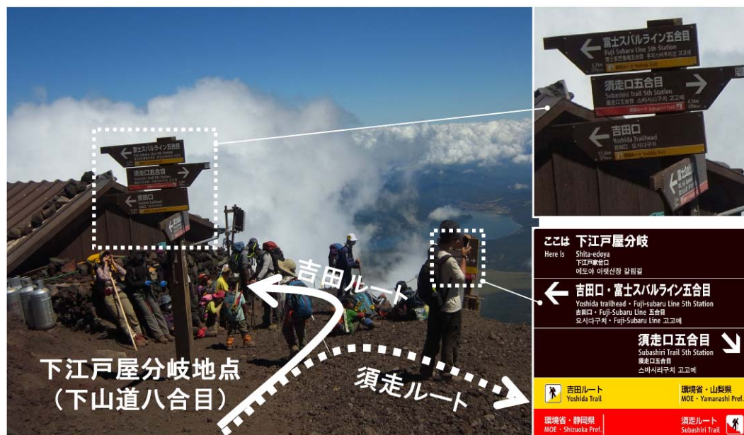
図 吉田ルートと須走ルートの下山道分岐地点